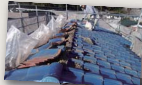
弊社で行った 耐震改修工事

古い建物は、耐震性が低く、さらに屋根に瓦が載った建物の場合には、瓦の重量が重く、地震の揺れに耐え切れず下部の木造柱が倒れてしまうケースは多いです。私達も頭の上に重い物を載せて歩くと、バランスを取るのに難しい経験があると思います。それと同じで、耐震性向上のためには、建物上部に重い物があると危険です。