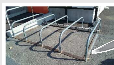
▲劣化し、色あせたカート置き場が

色むらがしにくく、誰でも簡単に鮮やかな光沢のあるシルバー色での仕上げ、可能になります。その仕上がりは思わず“キレイ”と声が出てしまうほどです。